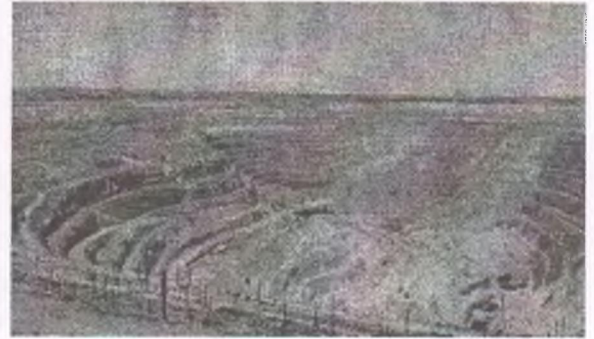
Рисунок 2 – Сарбайский железорудный карьер

Процесс организации маркшейдерского геомониторинга включает в себя: выбор потенциально неустойчивых и неустойчивых участков на основе анализа инженерно-геологических и горно-технических условий разработки для закладки наблюдательных станций; разработку проекта наблюдательных станций за деформациями откосов, учитывающего значительную глубину карьера; перенесение проекта наблюдательных станций в натуру и закладку реперов; привязку опорных реперов (определение координат X, Y, Z) к ближайшим пунктам маркшейдерской опорной геодезической сети; определение положения конт-