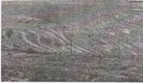
Рисунок 1 – Соколовский железорудный карьер

Процесс организации маркшейдерского геомониторинга включает в себя: выбор потенциально неустойчивых и неустойчивых участков на основе анализа инженерно-геологических и горно-технических условий разработки для закладки наблюдательных станций; разработку проекта наблюдательных станций за деформациями откосов, учитывающего значительную глубину карьера; перенесение проекта наблюдательных станций в натуру и закладку реперов; привязку опорных реперов (определение координат X, Y, Z) к ближайшим пунктам маркшейдерской опорной геодезической сети; определение положения конт-